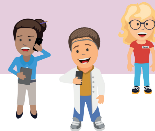
Figuren aus der Film-Clip Reihe „Die Azubis“

Jede Medienführerschein Werkstatt steht als teachSHARE-Kurs auf mebis zur Verfügung. Für die Nutzung wird ein mebis-Account benötigt.